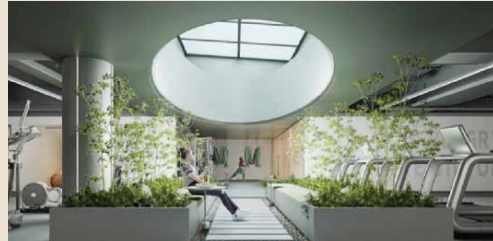
廈門 · 中駿天禧堂前會所效果圖（健身房）