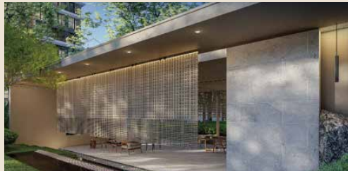
廈門 · 天禧茶亭效果圖

中駿集團開創了「社區茶亭」的先例，在園林設計中營造茶亭，將自然、生活、人文交織相融，成為了中駿獨有的社區IP。中駿茶亭還貼心預留隱蔽式戶外電源、淨水供應設施、清洗設施、用具收納櫃等，打造第二會客廳。