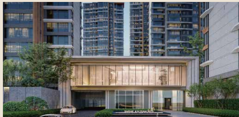
廈門 · 中駿天禧堂前會所效果圖（門庭）

中駿集團成立研究團隊創新研發社區「堂前會所」，設置在住戶高頻使用的社區入口。門庭盡顯沉穩大氣，視野闊達的車行通道、全景玻璃服務崗亭、與半遮半掩的人行門庭，構成「三段式入口」。在家門口築起「一站式服務場」，提供書吧，健身房，兒童活動區，休閒區等設施。