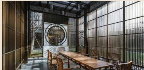
北京 · 天宸茶亭實景圖