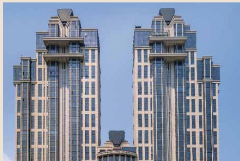
廈門 · 天峰實景圖

2010年中駿集團成立「外立面0管線」設計小組，首個項目落地廈門中駿天峰。10年後，天峰仍是廈門海岸線上的地標性建築，立面恒新如初。